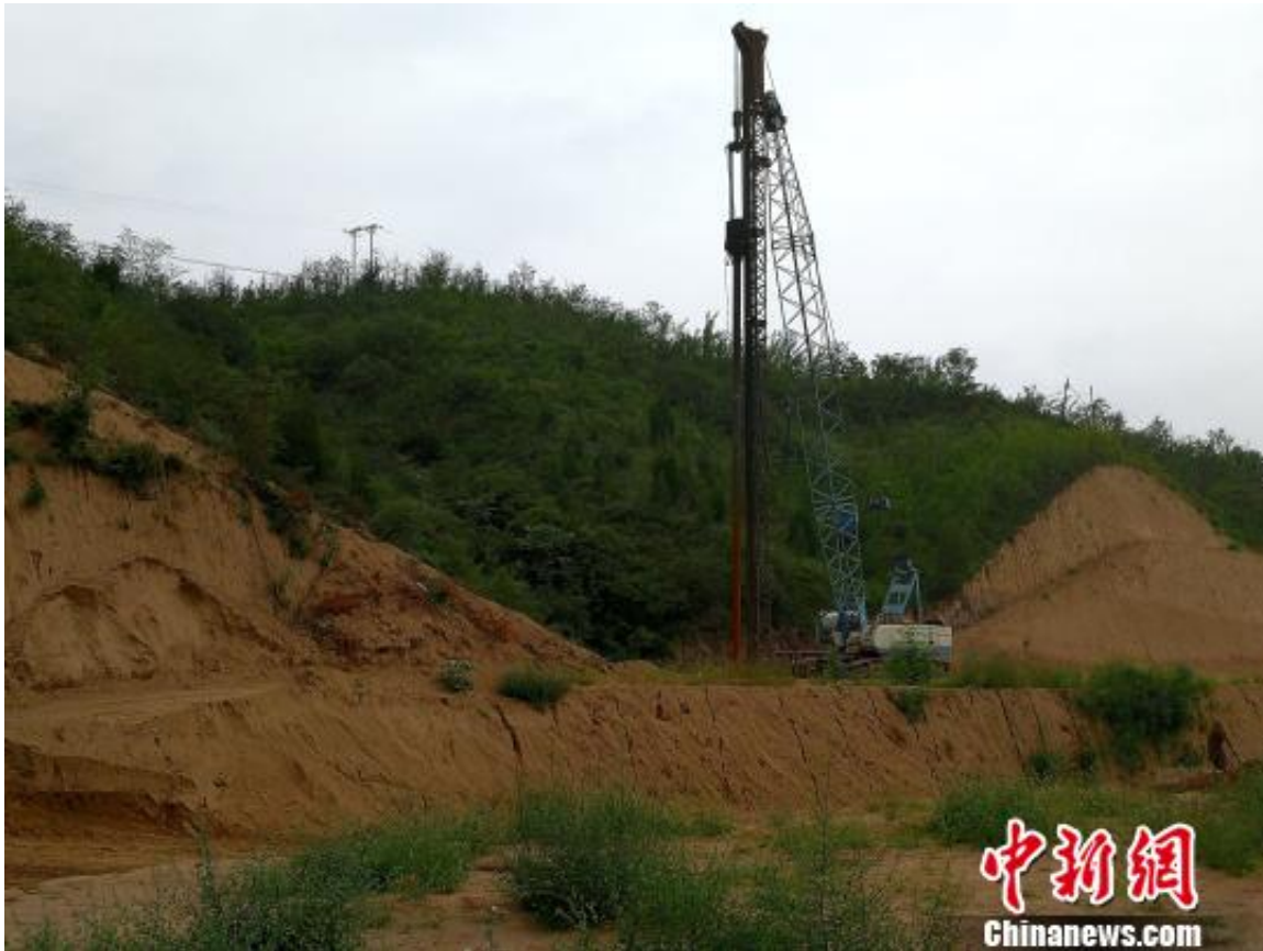
图为被破坏的山体。

据相识，这里正在施工建设“黄河壶口游客接待中央”，是景区供游客休息的场所，包罗一处可以停放上千辆汽车的大型停车场，占地一百亩，企图投资5亿多元。记者看到，原先山坡上的部门林木已经被毁掉。对此，宜川县林业局和宜川县森林公安局卖力人表现此事正在观察相识中。宜川县林业局事情职员出示的一份《延安市林业局文件处置惩罚单》显示，延安市林业局要求宜川县林业局于9月1日前上报壶口毁林建设一事的观察效果。而壶口瀑布景区事情职员则以卖力人开会出差不在为由，拒绝了采访。