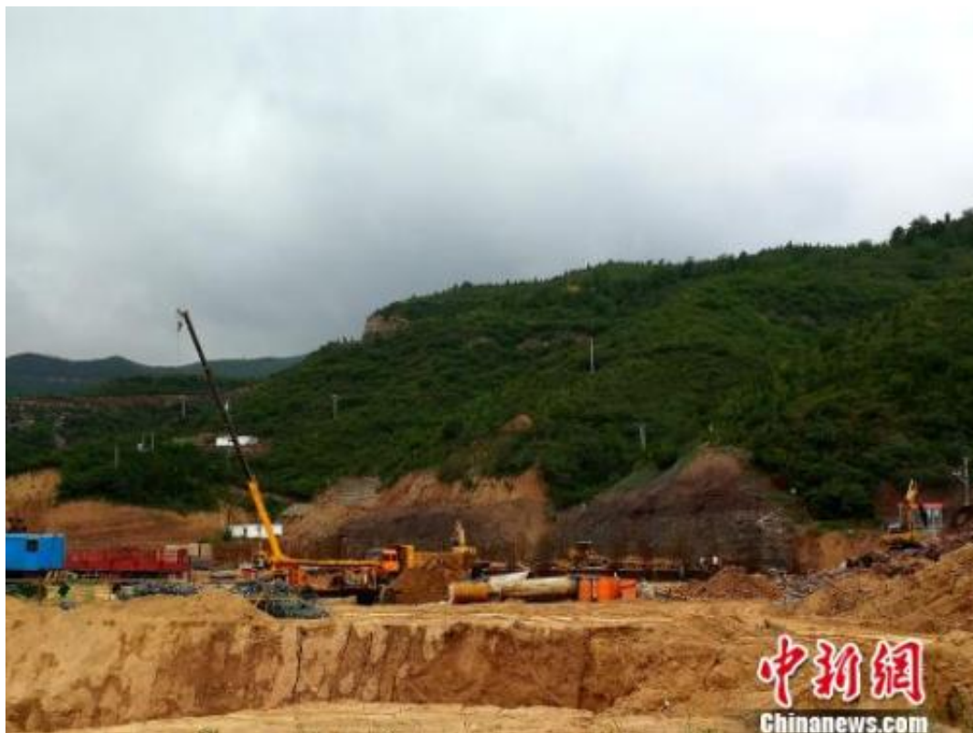
图为施工现场。 高庆国