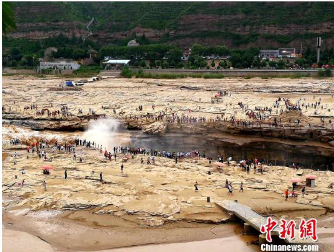
图为黄河壶口瀑布。

记者相识到，现在“黄河壶口游客接待中央”项目的林业手续仍在报批阶段，最先施工后，当地林场的事情职员曾去现场下发过整改通知书，但都没有用果。宜川县森林公安局前往执法时也受到施工方阻挠。